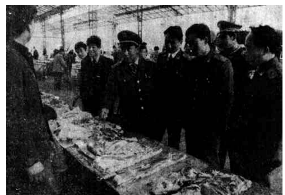
▲ 东营工商分局东城工商所针对群众反映的猪肉注水问题,专题抓不懈,坚持天天检查,摧垮注水,保护了消费者权益。

河口讯 河口区立足“双高一优”农业的发展,充分发挥土地、草原和海洋、滩涂的优势,加快产业结构调整步伐,以专业村和专业大户建设为龙头,积极推进全区林牧渔业的产业化。 这个区努力搞好林果产业化开发。充分利用黄河故道的土地资源,因地制宜,适地适林,稳定苹果种植面积,狠抓枣粮、棉粮间作,加强科技、储运、销售服务体系,瞄准外埠市场,加快发展步伐。1995年重点搞好义和镇2万亩林果开发,优化品种结构,突出“名、特、优”生产。进一步增强和壮大果品业开发服务中心的科、储、销实力,将其建设成为全区果品生产的龙头企业,并不断开拓干、鲜果品加工业,实现增值增收。同时重点扶持果品大户和河口林场建设,充分发挥典型辐射作用。二是搞好畜牧产业化开发。坚持草原畜牧与农区畜牧并举、养殖与加工相结合,点上突破、整体推进的原则,大力促进畜牧业产业化生产。充分发挥草场资源优势,重点搞好2万亩草场封育,增加草场载畜量1.8万头。规划并实施万头牛、2万只羊乡镇建设,重点抓好新户万头牛乡镇和新户、太平、六合2万只羊乡镇建设。同时切实搞好农作物秸秆的综合利用,大力发展以牛、羊、鹅、兔等为主的草食类畜禽的家庭养殖。有关部门正在着手研究制定政策,采取区乡两级资金扶持与农民加大投入相结合的办法,突出抓好专业村和专业大户建设,实施“龙头”带动战略,并搞好屠宰、加工等基础设施建设,培植畜牧增值龙头企业,逐步实现养加销一条龙。三是搞好渔业产业化开发。坚持以养为主、养捕并举、加工增值、提高效益的方针,全力实施以东营海港为依托,以新户渔港、黄河渔港为犄角,两翼展开,全面推进的“海上河口”建设战略构想。认真总结汲取近年来滩涂养殖的经验教训,大力发展贝类养殖,特别是要制定政策,建立队伍,采取得力措施抓好文蛤资源的养护。今年重点抓好新户乡20万亩文蛤富集区管护试点工作,护养文蛤资源9万亩,文蛤暂养面积达到500亩,新开发滩涂养殖1万亩。区乡两级广拓融资渠道,积极筹措资金,组织引导渔民向深海、远海进军,走“大渔业”的路子。同时重点搞好新户渔港二期工程建设和黄河渔港的论证立项工作,抓好海产品加工和流通工作,实现由产销腌制品、初级冷冻品到产销高附加值产品和鲜活产品的转移,提高产出效益。(郭本东)